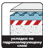
укладка по гидроизолирующему слою