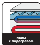
полы с подогревом