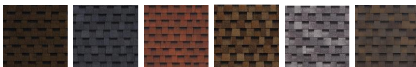
Коричневый Серый Красный Бронзовый Серебро Охра